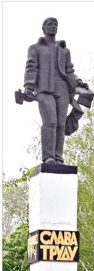
Монумент «Слава труду»