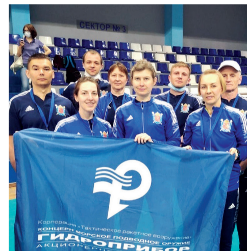
1. Гидроприборовцы – на почётном одиннадцатом месте! 2. Команда с флагом предприятия, фото на память