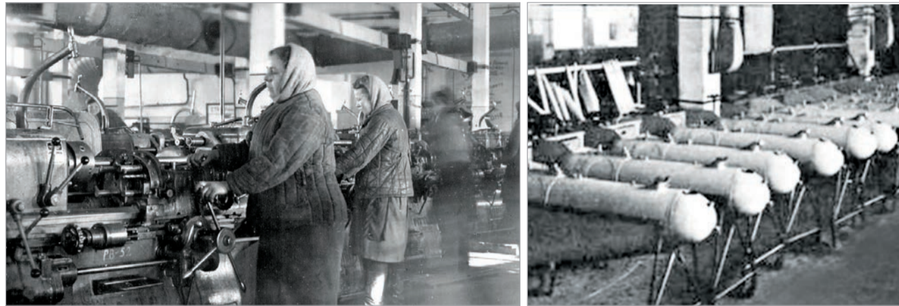
За станки вставали женщины – взамен ушедших на фронт мужчин; партия готовой продукции – выливных авиационных приборов готова, 1942 год

Завод №455 Второго главного управления Наркомата авиационной промышленности (головного предприятия КТРВ), созданный в городе Костино Московской области 3 июня 1942 года, до самого победного мая обеспечивал фронт вооружением